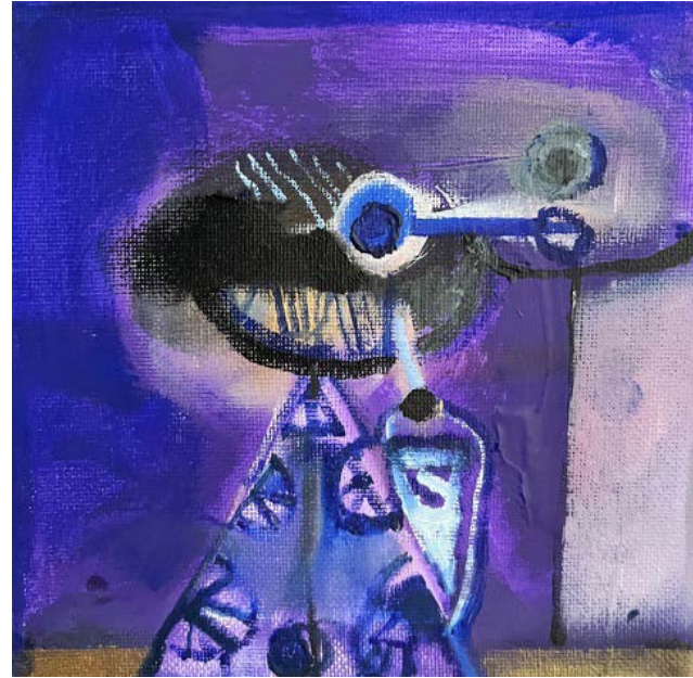
GEJSZA (2) / 15 x 15