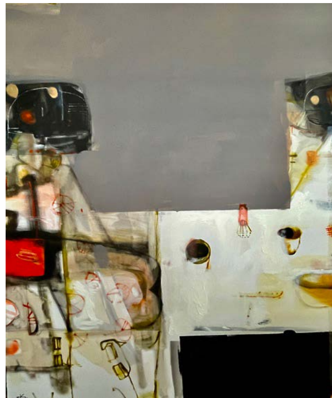
MATCHA TIME / 100 x 120