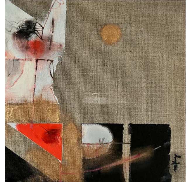
GYM / 30 x 30