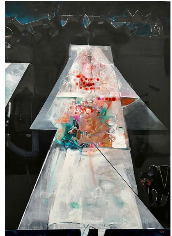
PANNA MŁODA / 120 x 150