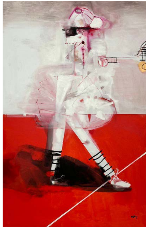
TENISISTKA / 80 x 120