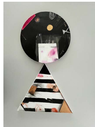
KOKESHI (3) / 60 x 30