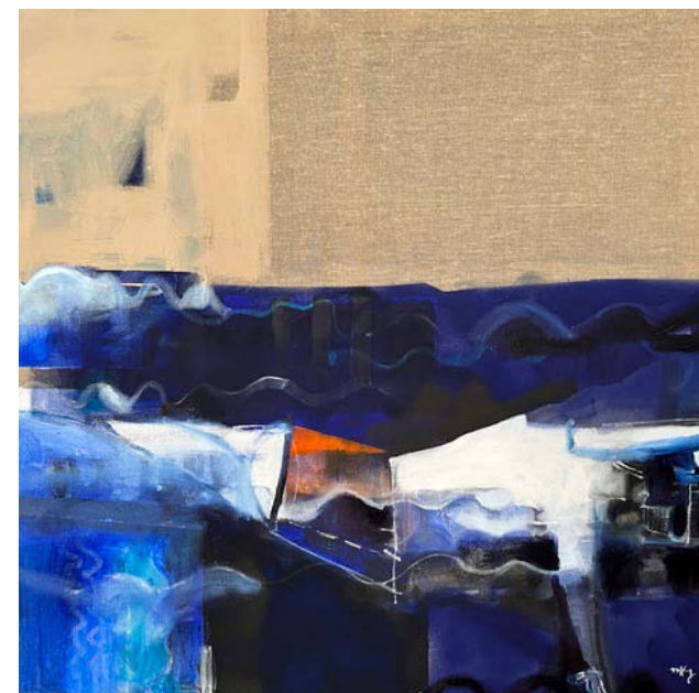
GYM (SWIMMING) / 100 x 100