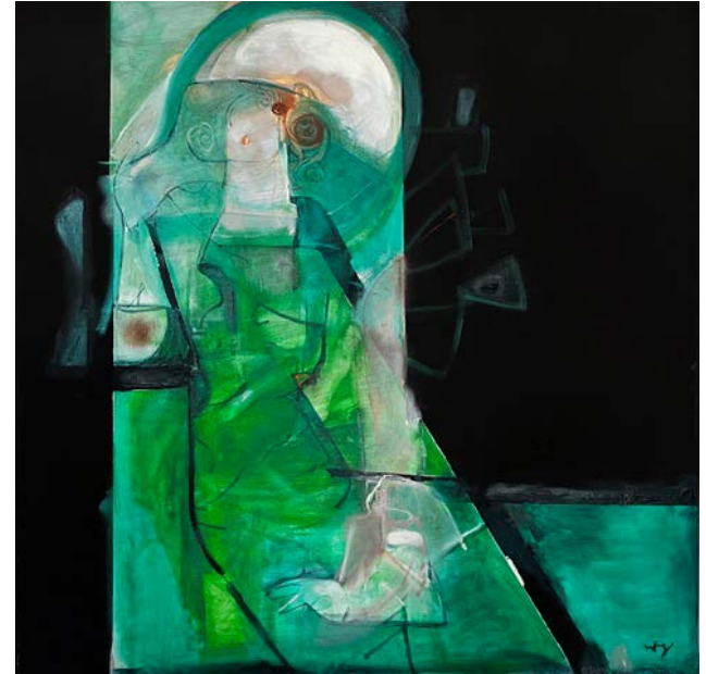
MŁODA KOBIETA W BIAŁYCH RĘKAWICZKACH (LEMPICKI) / 80 x 80