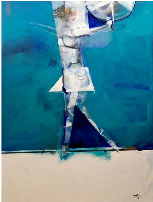
AKROBATKA NA LINIE / 60 x 80