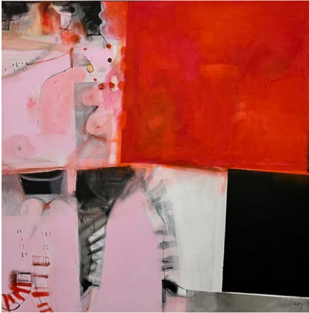
LOVE / 100 x 100