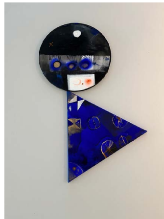
KOKESHI (1) / 60 x 30