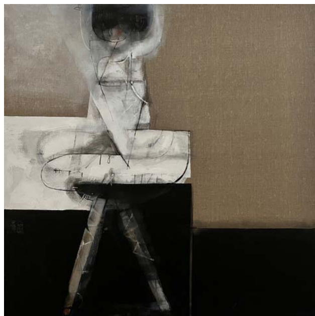
FIGURA BALETOWA / 100 x 100