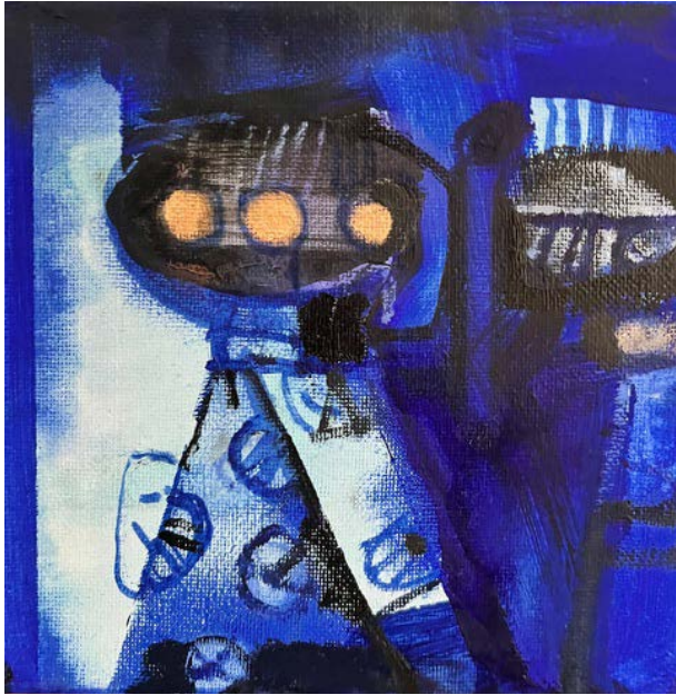
GEJSZA (1) / 15 x 15