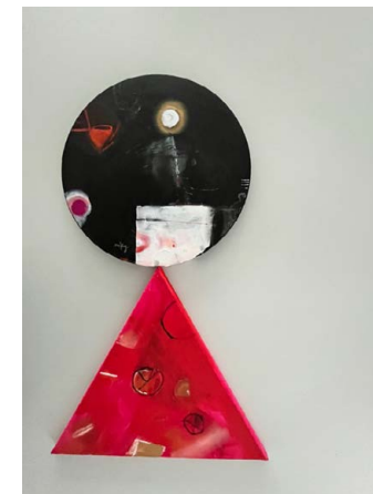
KOKESHI (4) / 60 x 30