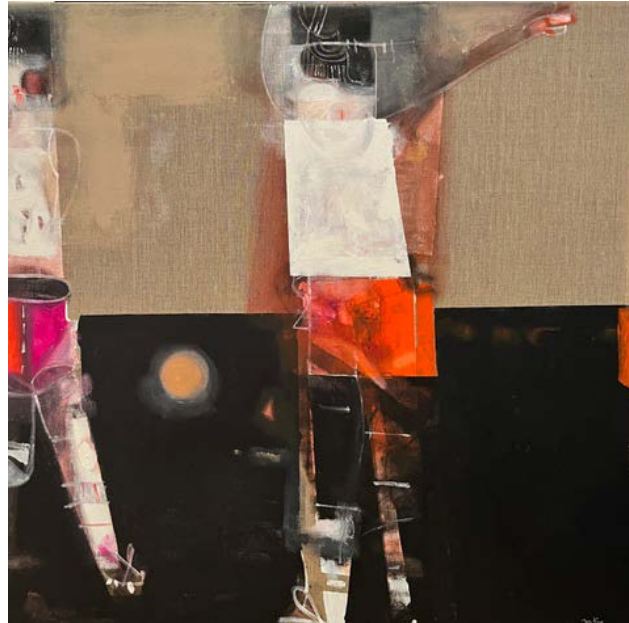
GYM (OFFSIDE) / 100 x 100