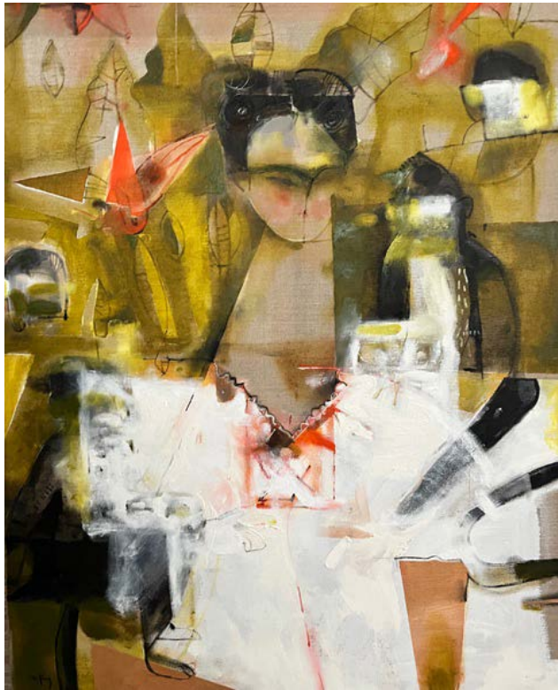
FRIDA I MALPY (FRIDA KHALO) / 80 x 100