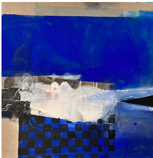
FIGURA NA KOCU / 80 x 80