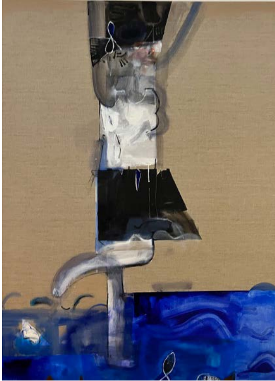
NAD BAŁTYKIEM / 100 x 120