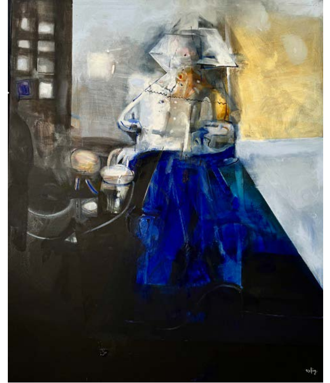
MLECZARKA (JOHANNES VERMEER) / 100 x 120