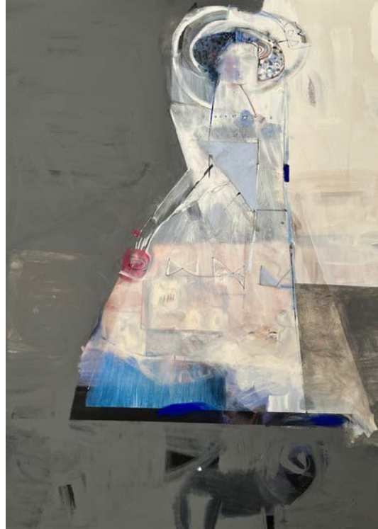
MARKIZA Z MOPSEM / 100 x 120