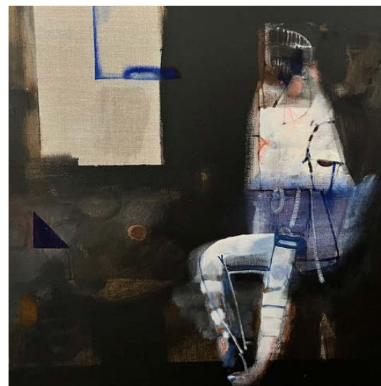
TRÓJKĄTY I KWADRATY / 50 x 50