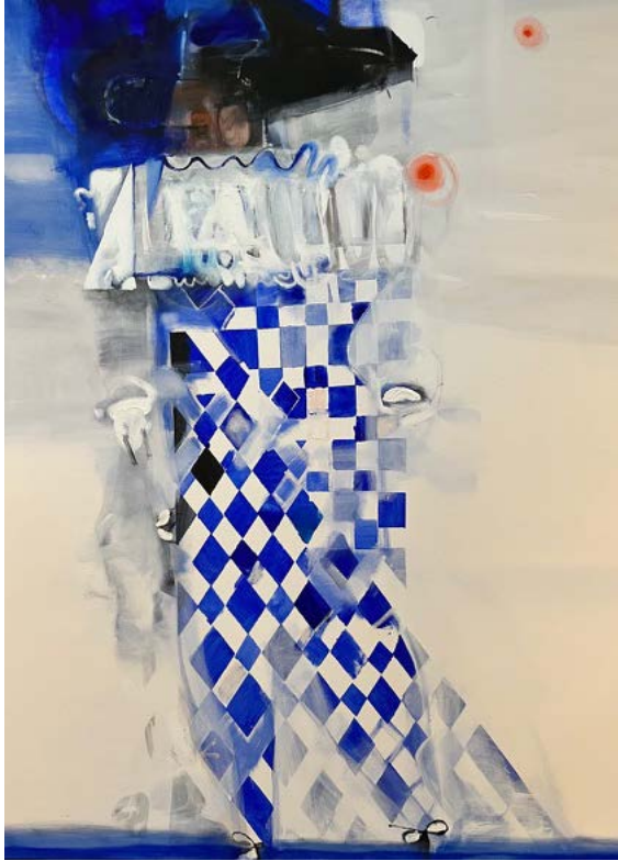
HARLEKIN ŻEGLUJĄCY / 100 x 120