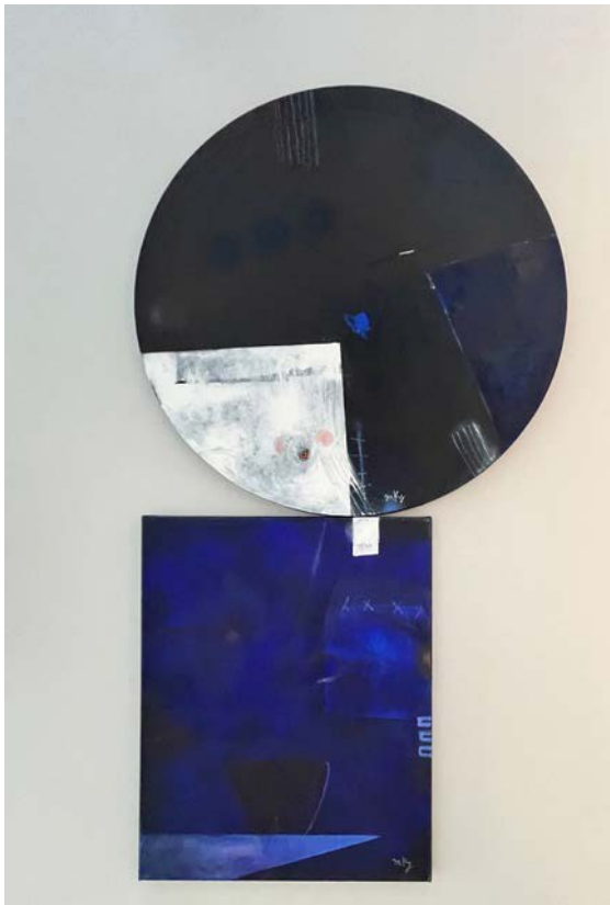
KOKESHI (GRAND) / 110 x 60