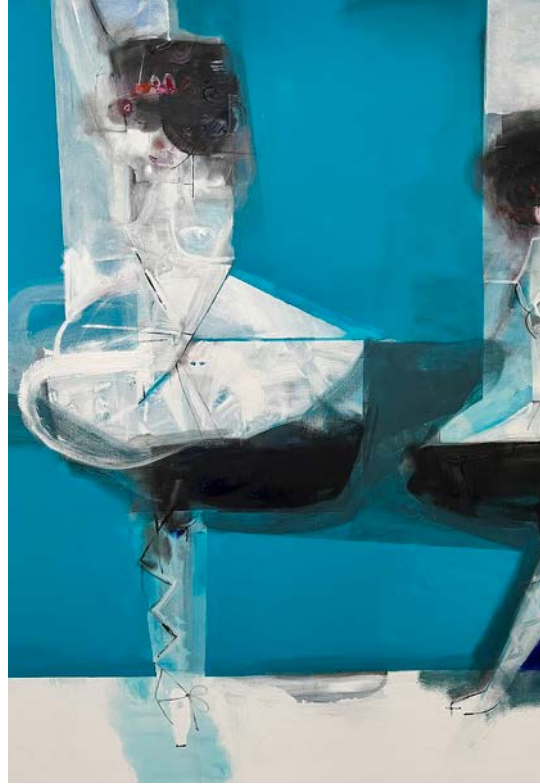
TANCERKI (EDWARD DEGAS) / 100 x 120