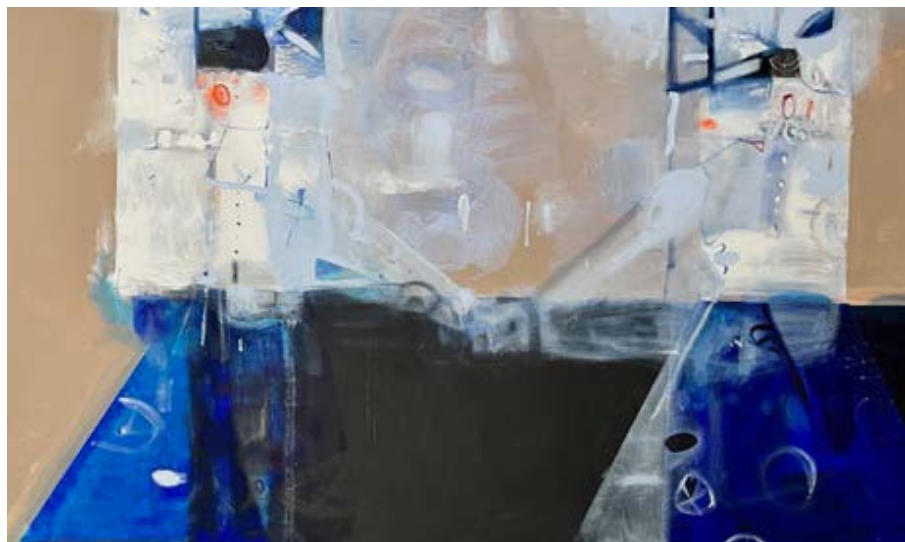
BLIŹNIACZKI / 90 x 200