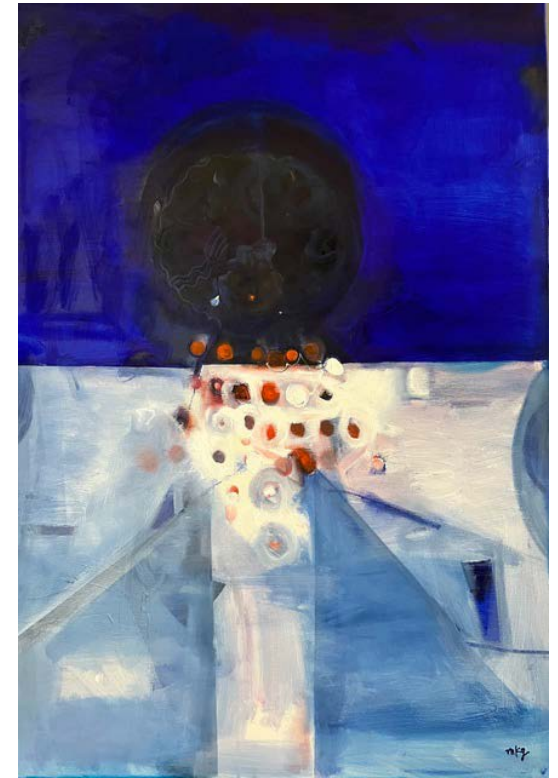
I WILL SURVIVE / 70 x 100