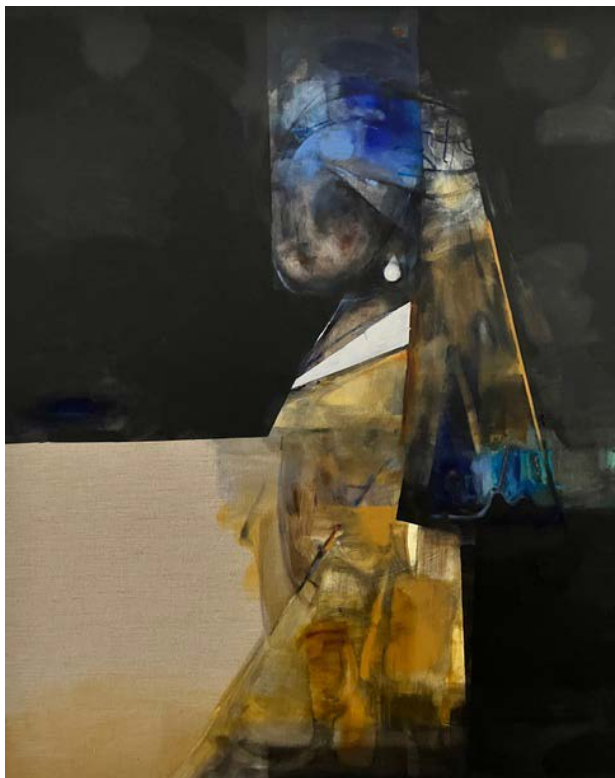
DZIEWCZYNA Z PERŁĄ (JOHANNES VERMEER) / 100 x 120