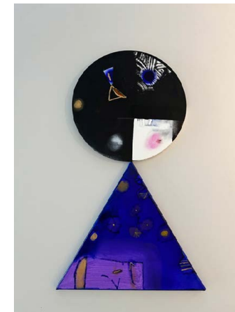
KOKESHI (2) / 60 x 30