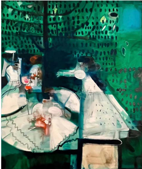
KOBIETY W OGRODZIE (MONET) / 100 x 120