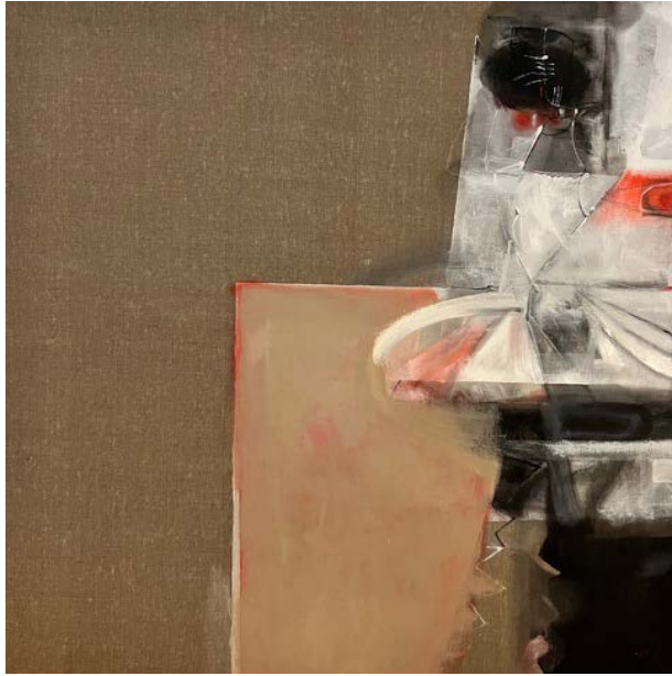
BALET / 100 x 100