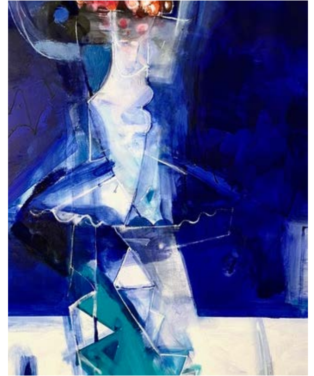
TANCERKA / 100 x 120