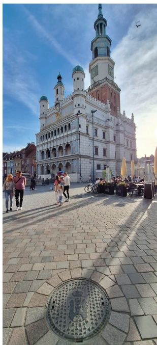
28 marzec 2024

Zapraszamy do Vinci Art Gallery ul. Rynek Śródecki 15/2, Poznań wt - pt 12 00 - 18 00 · sob 12 00 - 16 00